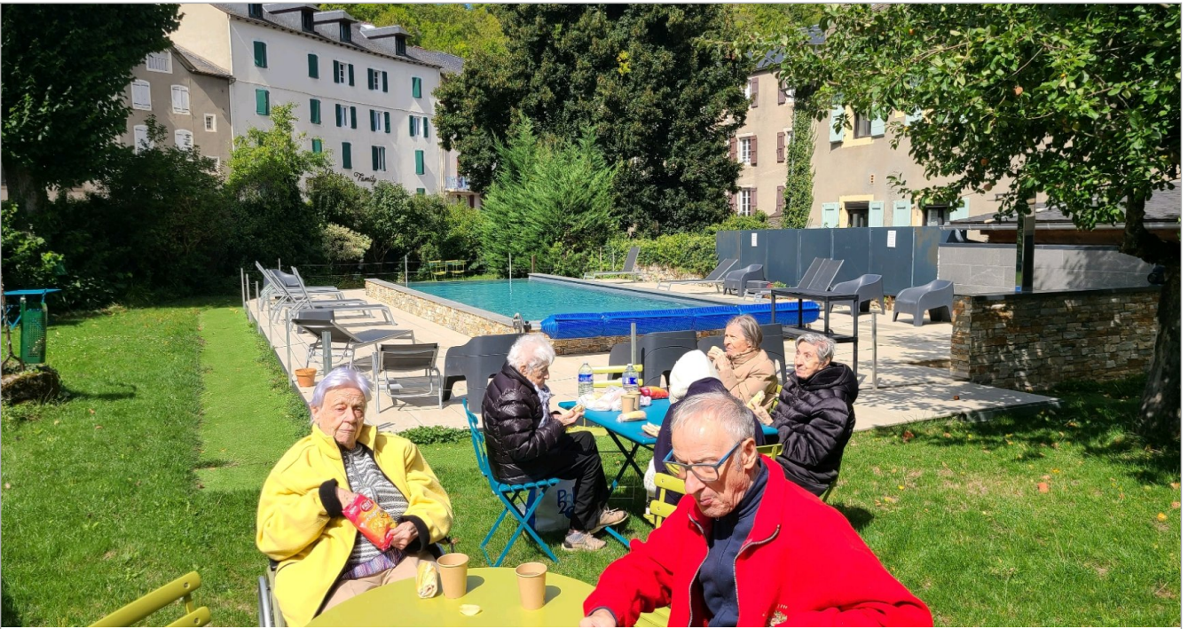
Arrêt pique nique à Meyrueis et un retour par le causse noir, très belle journée.